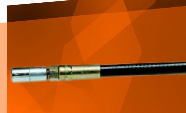
Шланг высокого давления с цанговой головкой